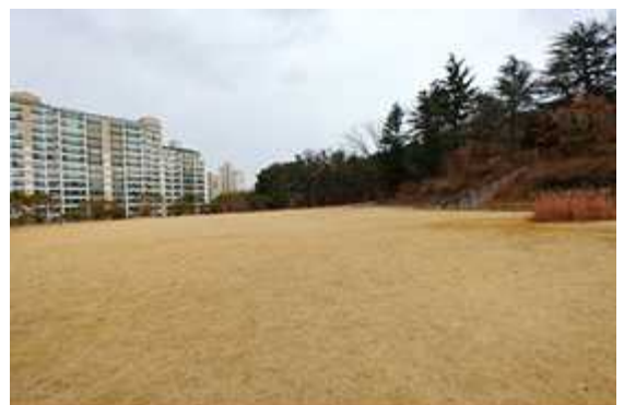
< 잔디광장 >