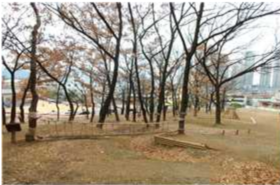
< 숲 놀이터 >