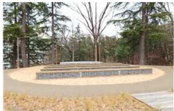
< 야외무대 >